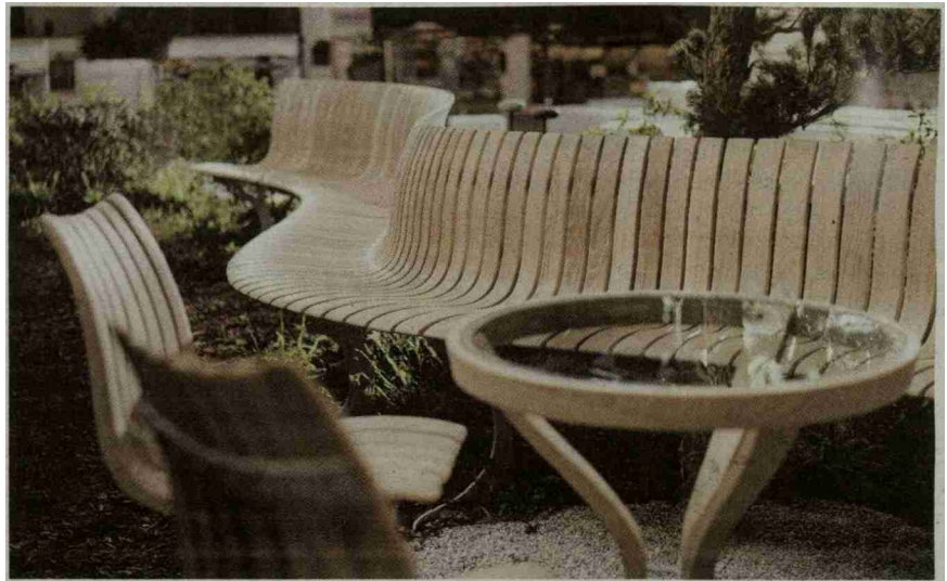
Marktreife Innovation: Das parametrische Outdoor-Sitzsystem «Harmonica».

Die K. Winkler AG mit ihrer Werkstätte bei der Aare-mündung in Felsenau ist eines von noch drei Schweizer Unternehmen, welche die Holzbiegetechnik beherrschen. Das KMU hat sich vom Zulieferer von Halbfabrikaten zum Anbieter von kompletten Massivholzlösungen entwickelt. Keiner bietet im Bereich der runden Formen ein breiteres Sortiment an. Die Anwendungen reichen von Möbeln über den Innenausbau bis zum Holzbau. Neben B2B-Kunden beliefert Winkler auch Private und In-